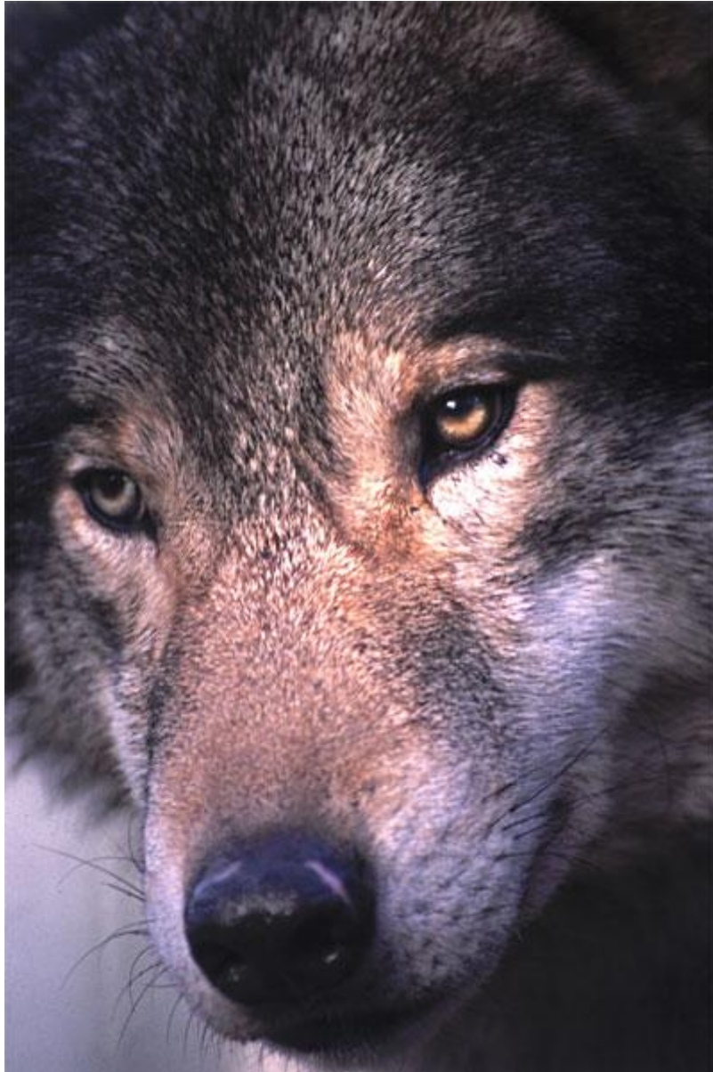
Nedan: Sesamfärgad eller som man ibland kallar det viltfärgad, shiba. Här ser man tydligt hundens släktskap med vargen, ovan.